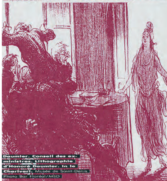
Daumier, Conseil des ex-ministres. Lithographie d'Honoré Daumier. In le Charivari. Musée de Saint-Denis.