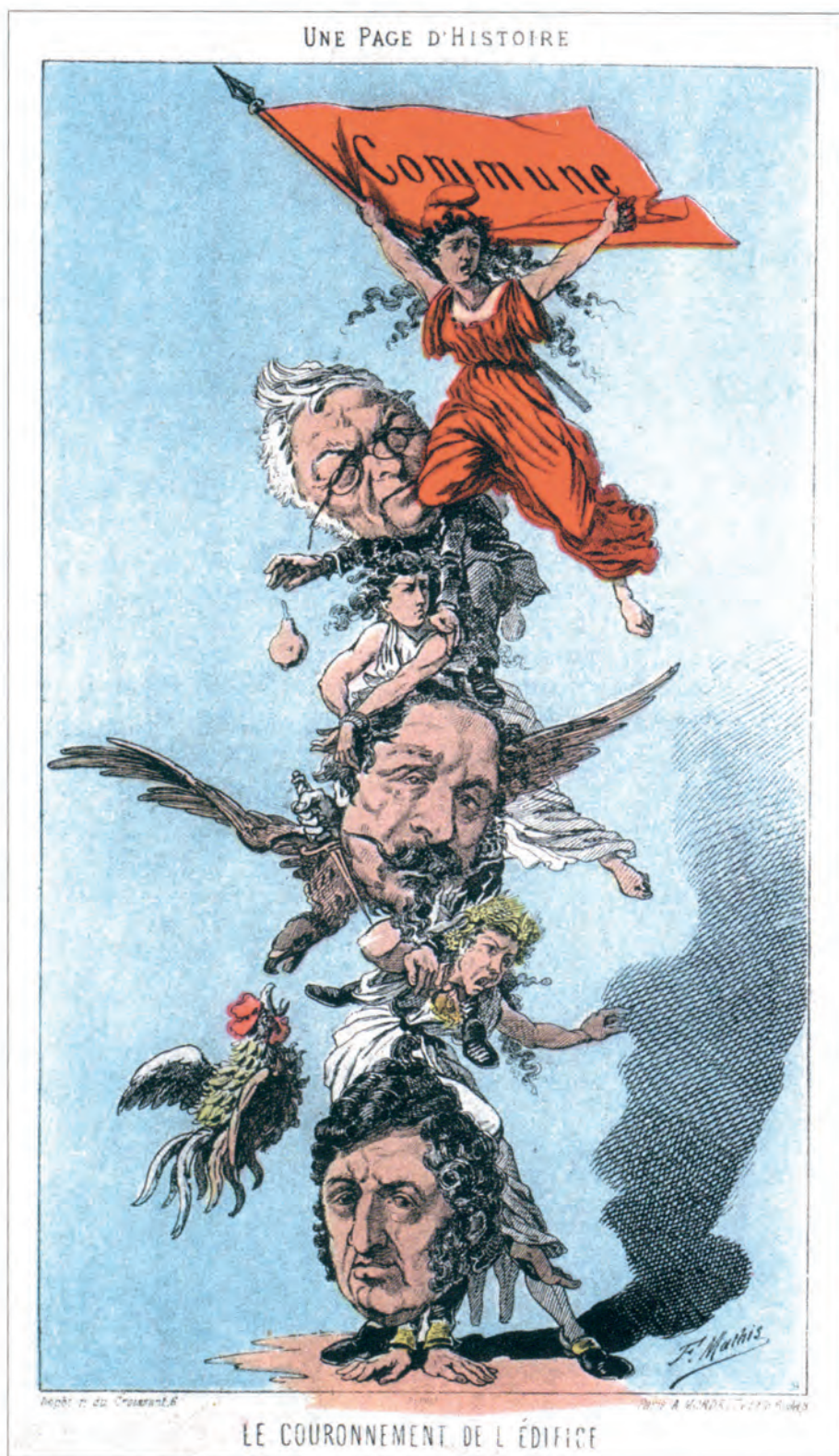
Commune de Paris. Allégorie de F. Mathis.