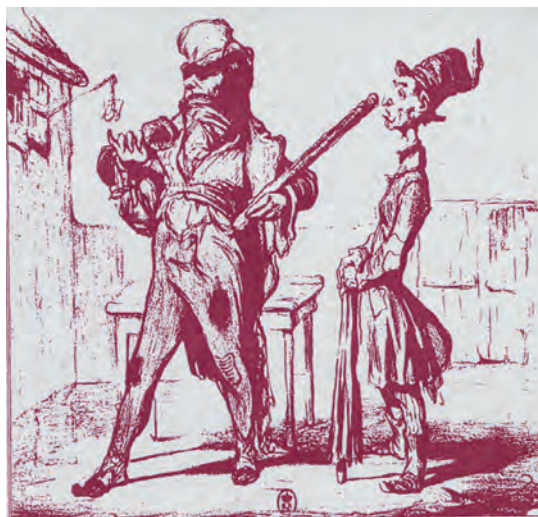
Daumier's yndes l'industrie. "Le travail n'est pas une femme, mais la vie n'est longue". "Quel est le mal de l'industrie n'est malade de l'industrie, l'industrie elle-même est la source de la vie, mais elle est la source de la vie, mais elle est la source de la vie..." "Pas, mais le grandiose..." "Rue de la République, 100 en ce qui est un excellent..."

Key Words: Marx Engels Institute; David Ryazanov; Soviet Archives; Stalinism.