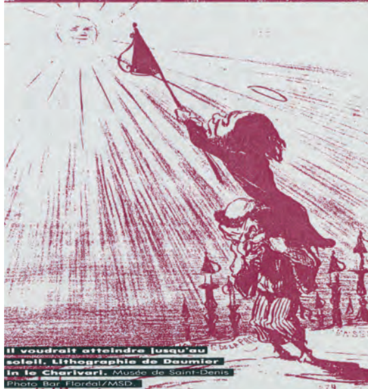
Il voudrait atteindre jusqu'au soleil. Lithographie de Daumier In le Charivari. Musée de Saint-Denis.