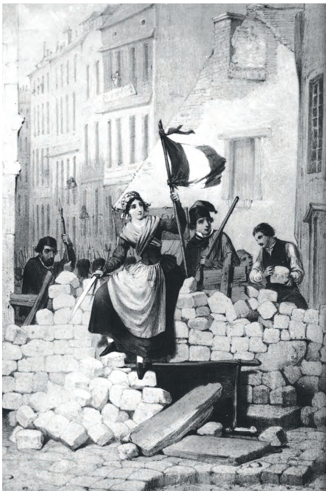
Février 1848 : le rôle des ouvriers est décisif comme le souligne Tocqueville dans ses Souvenirs. Dessin. Collection Musée de l' Histoire vivante. [Obtenida del libro: Maurice Moissonier y Claude Willard, Barricades: révoltes et révolutions au 19e siècle, Paris, MEssidor, 1991].