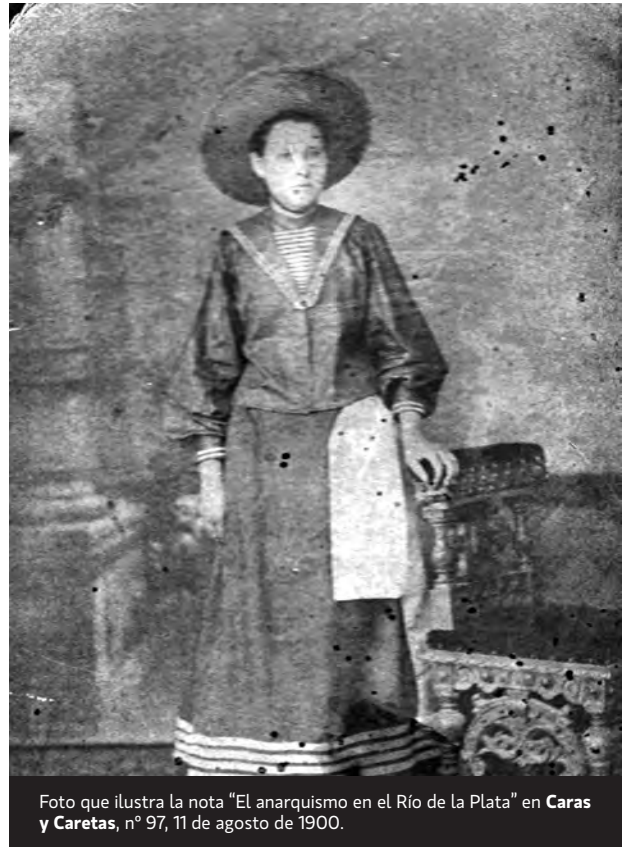
Foto que ilustra la nota “El anarquismo en el Río de la Plata” en Caras y Caretas , n° 97, 11 de agosto de 1900.

Los libertarios dejan en libertad a sus mujeres, porque saben que la mujer libre es la base de la sociedad justa; saben además, que si la mujer no es libre e instruida, no habrá paz en el hogar, pues sus ideas se volverían armas contra de ellos mismos; dejan en libertad a sus mujeres porque son libertarios, porque combaten por la libertad universal, que para conseguirla es necesario empe-