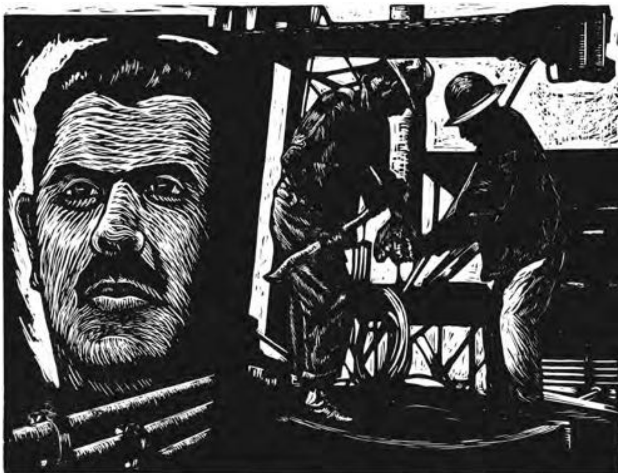
Jesús Álvarez Amaya "Lázaro Cárdenas y el Petróleo (18 de Marzo)" Xilografía impresa con tinta verde, 59 x 47.5 cm. (ca. 1960)