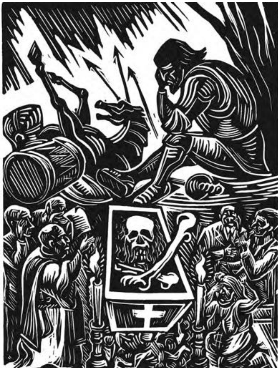
Jesús Escobedo "Los Huesos de Cortés" Linóleo 26 x 19.5 cm. (ca. 1960)