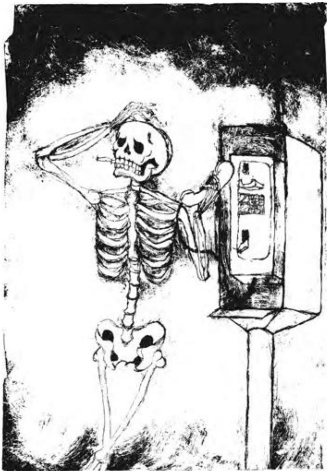
Rodrigo Morquecho "¡Esa era mi última moneda!" Huecograbado en punta seca sobre acrílico, 38 x 27 cm (2010)