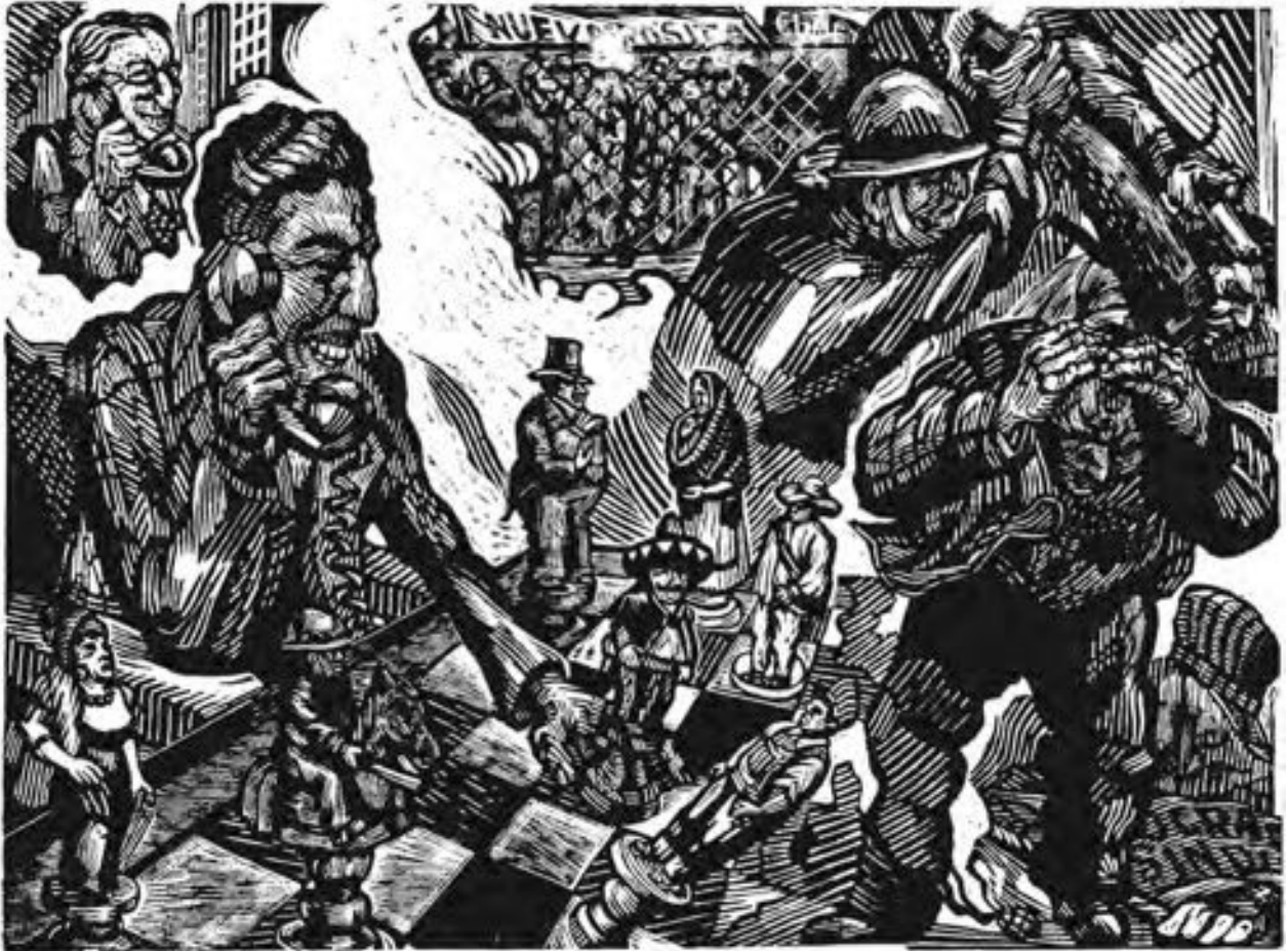
Ángel Bracho "Sometimimiento de los Sindicatos" Linóleo, 30 x 22.5 (ca. 1960)