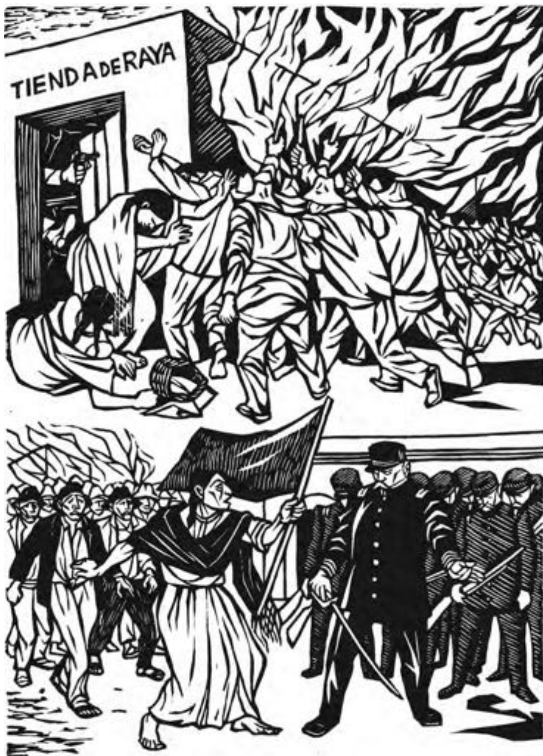
Fernando Castro Pacheco "Huelga de Río Blanco" Linóleo, 29 x 21 cm. (1947)