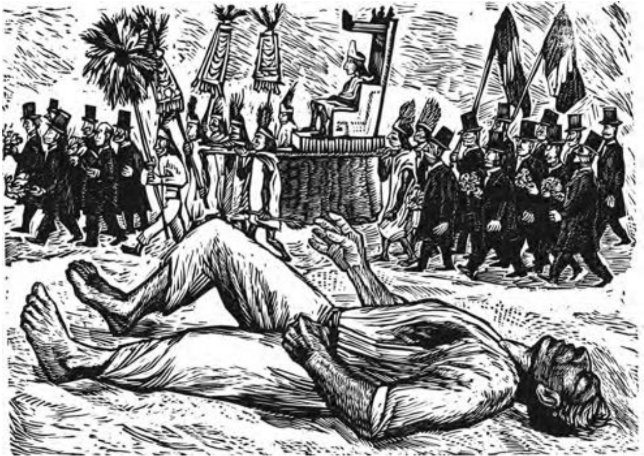
Alfredo Zalce "La Dictadura Porfiriana exalta demagógicamente al indígena" Linóleo 30 x 21.5 cm. (ca. 1947)