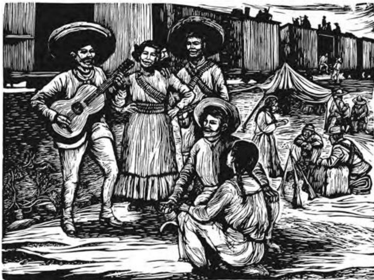
Mariana Yampolski "Vivac de revolucionarios" (Estampas de la Revolución Mexicana) Linóleo, 21 x 29 cm. (1947)