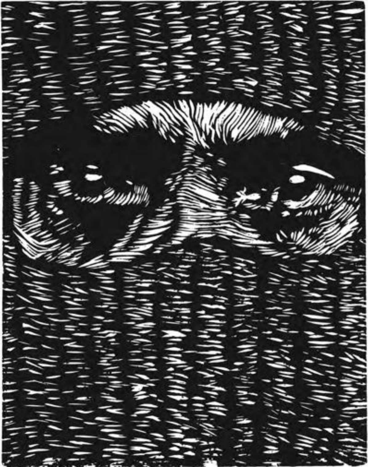
Víctor Rizo García Sin título [Zapatista] Xilografía, 28 x 22 cm. (2012)