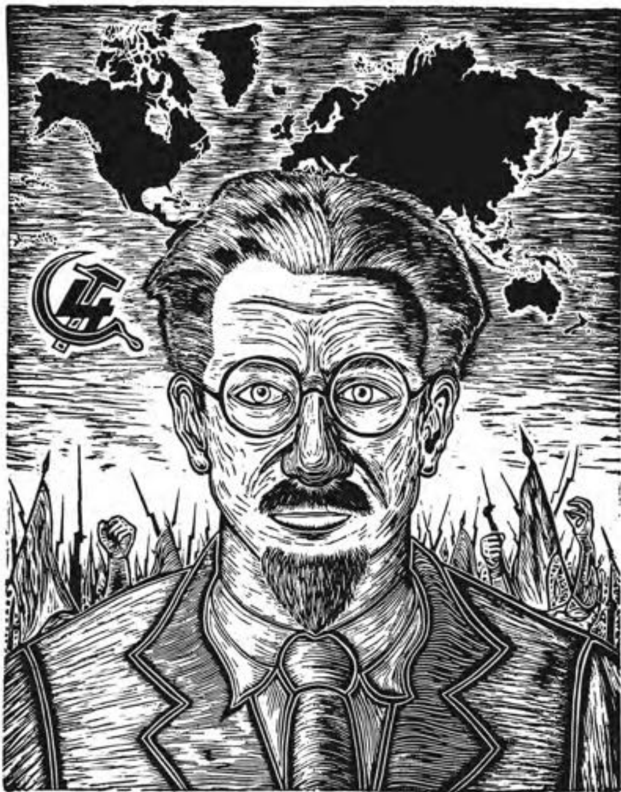
Eleazar Hernández "León Trotsky" Linóleo, 38 x 28 cm (2009)