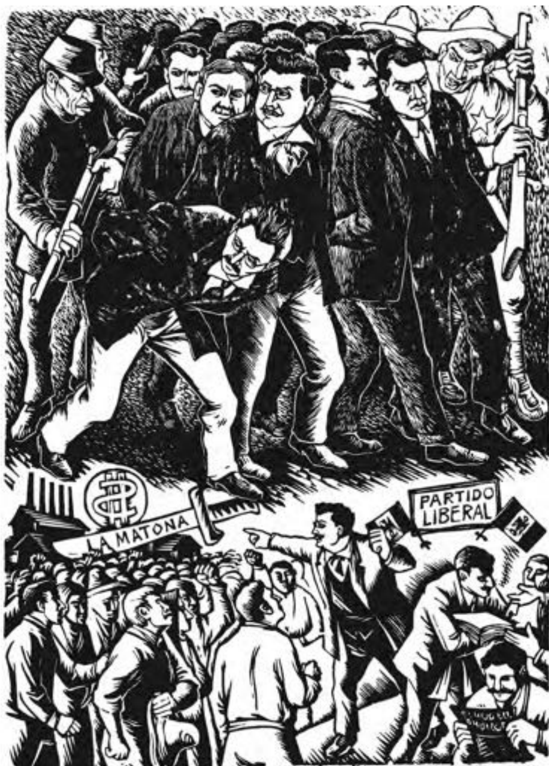
Alberto Beltrán "Persecución del Partido Liberal" Linóleo, 49.5 x 32 cm. (ca. 1959)