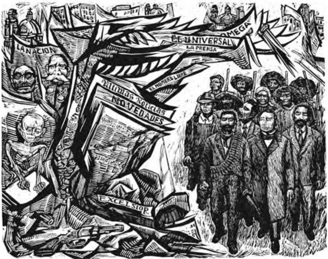
Alfredo Zalce "Prensa reaccionaria ante la lucha social histórica" Linóleo, 39.5 x 31.5 cm. [s/f]