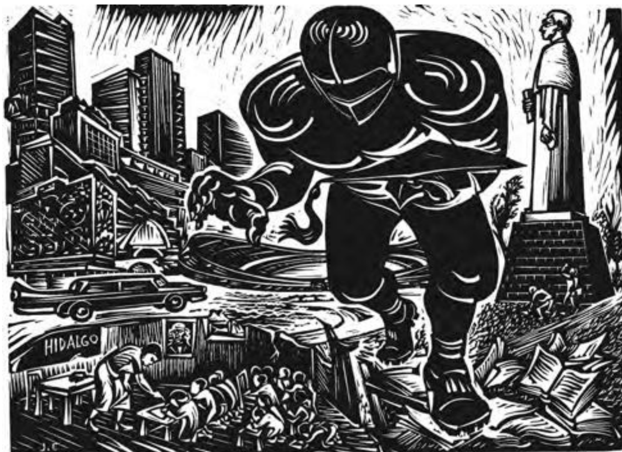
Jesús Escobedo "Escuelas pobres y Universidad suntuosa" Linóleo 30 x 22 cm. (1960)