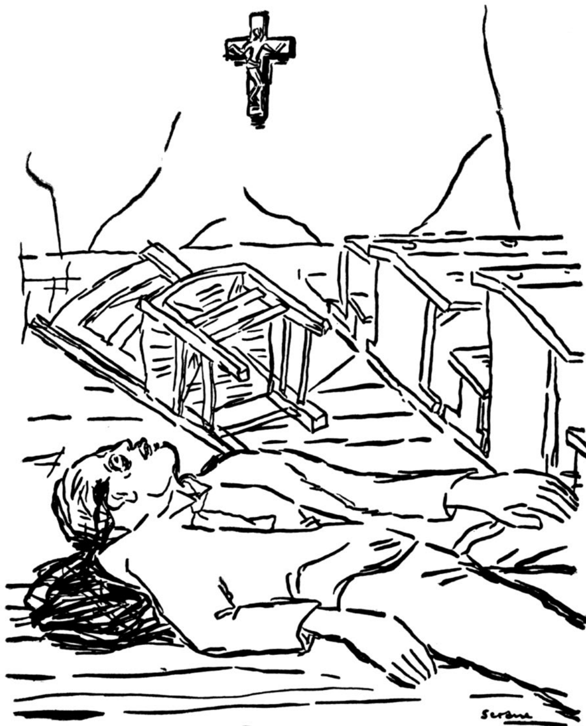
Impusieron o Cristo n.a escola