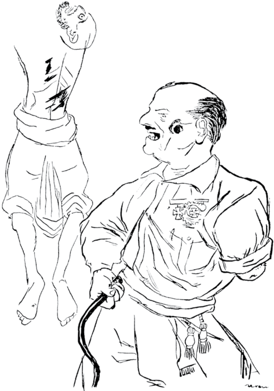
O amigo entrañable dos mouros